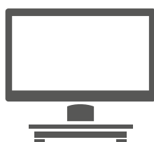
POS 7 Variante Pied

La boîte système peut facilement être séparée du reste du matériel et peut par exemple être suspendue sous votre comptoir. Cela vous facilite la manipulation des câbles et offre la possibilité d'un montage sur pôle ou mural.